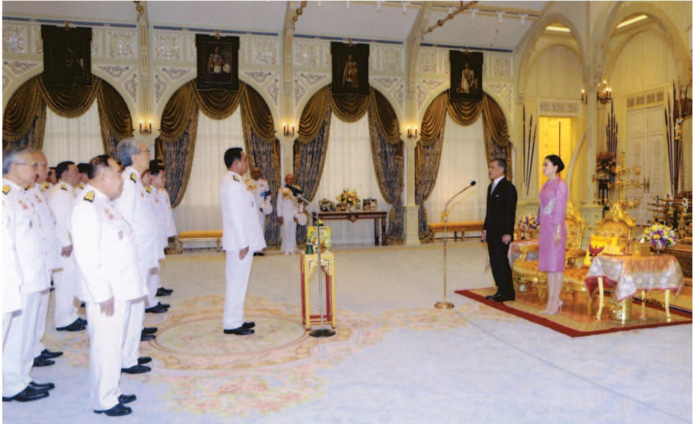
พระบาทสมเด็จพระเจ้าอยู่หัว เสด็จออก ณ พระที่นั่งอัมพรสถาน พระราชวังดุสิต พระราชทานพระบรมราชวโรกาสให้ พล.อ.ประยุทธ์ จันทร์โอชา นายกรัฐมนตรี นำคณะรัฐมนตรีที่ทรงพระกรุณาโปรดเกล้าโปรดกระหม่อมแต่งตั้ง เข้าเฝ้าฯ ทูลละอองธุลีพระบาท เพื่อถวายสัตย์ปฏิญาณก่อนเข้ารับหน้าที่ ในวันที่ 116 ก.ค.)