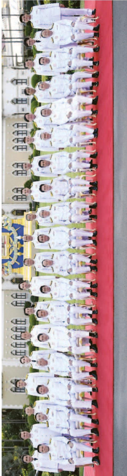
ถ่ายภาพพญู : พล.อ.ประยุทธ์ จันทร์โอชา นายกรัฐมนตรี ร่วมถ่ายภาพพญูกับคณะรัฐมนตรีใหม่ บริเวณสนามหน้าตึกไทยคู่ฟ้า หลังเข้าเฝ้าฯถวายสัตย์ปฏิญาณ พร้อมทั้งมีการประชุมคณะรัฐมนตรีครั้งแรก วานนี้ (16 ก.ค.)